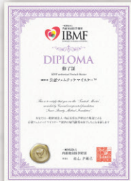
公認フェムテックマイスター® 認定証(ディプロマ)

41,800円(税込) ※別途年会費がかかります 個人会員:5,500円(税込) 法人会員:11,000円(税込)